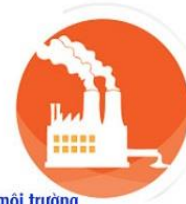
Ô nhiễm môi trường