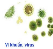
Ví khuẩn, virus